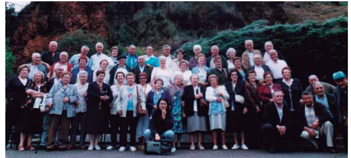
Taldea Cabarcenon bisitan.