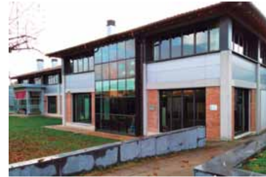
Udal erakundeetan lehenengo hitza euskaraz izango da, bai leihatilan eta bai telefonoz.

Zigoitiko Udalak, herritarrei, modu orokorrean, jakinarazten dien mezu laburren gehiengoa harrapatu, eta euskaraz eta gaztelaniaz izan dadin bermatu nahi da.