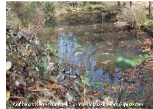
Anfibioak berreskuratzeko urmaela Jaizkibelen, Gipuzkoan.

Proiektuarekin Tokiko Agenda 21eko Ekintza Planean zehaztutako helburuetako bati erantzuna emango dio Udalak.