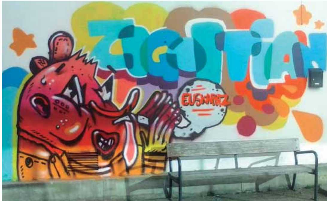
Igerilekuetako tabernako horman Gaztelekuko neska-mutilek egindako grafiti.

Gutxiengoan dagoen hizkuntzari espazio berriak zabaltzeko helburuarekin