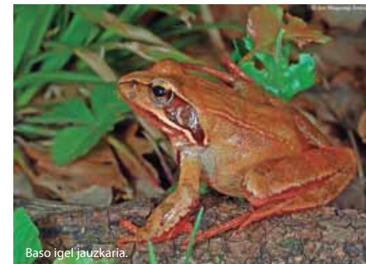
Baso igel jauzkaria.