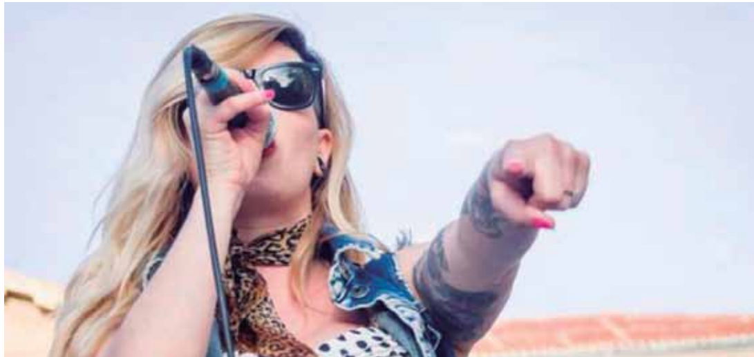
Furia euskal raperoa arduratu da tailerra emateaz.

80. hamarkadan sortu zen, Estatu Batuetako komunitate afroamerikarrean eta Hip Hop kultuaren barruan.