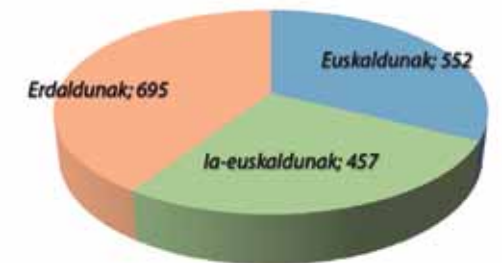
Zigoitia 695 erdaldun daude eta 1.009 euskaldun eta ia-euskaldun. Iturria: EUSTAT. Egilea: Soziolinguistika Klusterra. 2011ko datuak.

· Norbaitek eskaera bat euskaraz egiten badu, erantzuna gutxienez euskaraz jasoko du: udalera euskaraz jotzen duen herritarri berak aukeratutako hizkuntzan erantzutea, horixe da neurri honek jaso nahi duena. Une honetan, erantzun horri atxikitako dokumentazio guztia (adibidez, txosten espezifikoak...) elebitan sortzeko gaitasun nahikoa ez izan arren, gutxieneko bat bermatzea du helburu irizpide honek, eskubideak babeste aldera.