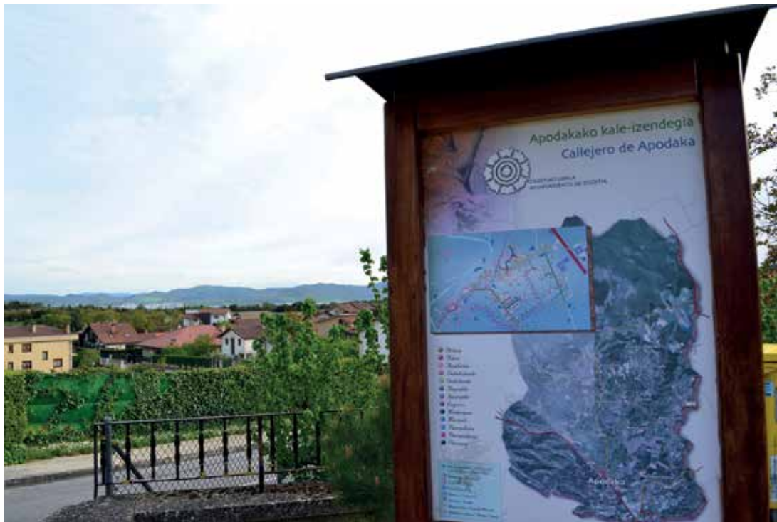
Irudietan, Apodaka herria.

Azaroaren 26an Zigoitiko herritarrak lau urtean behin egiten diren kontzejuetarako hauteskundeetan bozkatzera deituak daude. 808 emakume eta 961 gizonen osatzen dute hauteskunde hauetarako errolda. Hala ere, beti ez dakigu %100ean organo hauetan zer erabakitzen den, zein den hauen funtzioa edota zein bere lan esparrua.