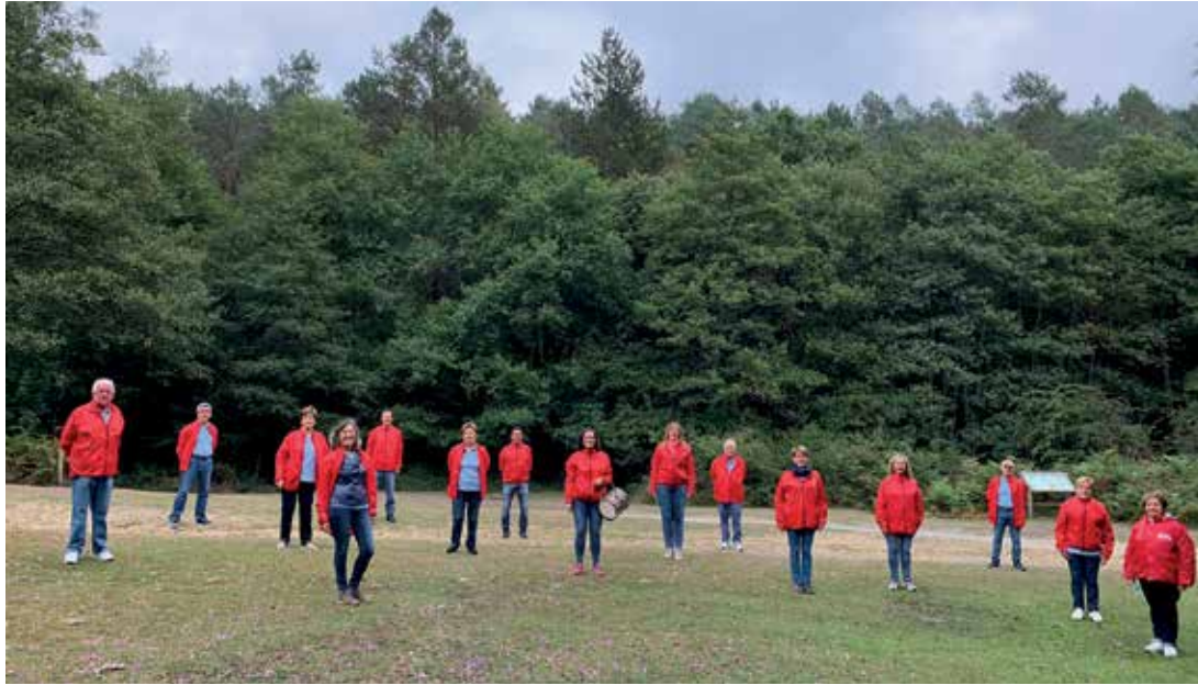
Testuak eta argazkiak: Mairu Abesbatza .

Zigoitiko abesbatza ez du pandemiak gelditu. Aitzitik, itsasoaren beste aldean ere jardun du, eta belarria gehiago findu behar izan du.