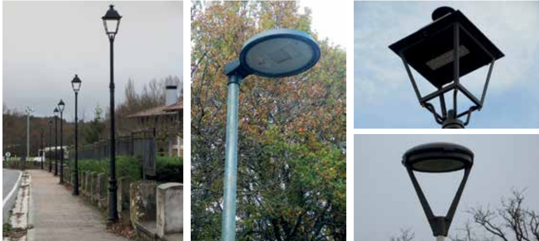
1.200 kale argi daude udalerrri osoan.

Jasangarritasunaren bidean, herri guztietako lehengo sodio-lurrunezko kale argiak aldatzen ari da Zigoitiko Udala. Horien ordean, Led teknologiadun bonbillak jartzen ari dira. Aldaketak elektrizitate-kontsumoaren jaitsiera nabarmena ekarri du. Horren ondorioz, alde batetik, argiaren fakturan % 50a aurrezteko lortu da, eta, bestetik, berotegi-efektuko gasen (BEG-en) isuriak nabarmen murriztea.