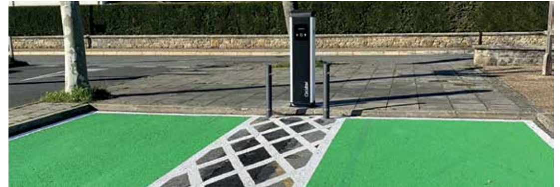
Udaletxeko aparkalekuan jarri dute kargalekua.

Instalaturako dorreak 2 ibilgailu kargatzea ahalbidetzen du, 40 bat minutuz