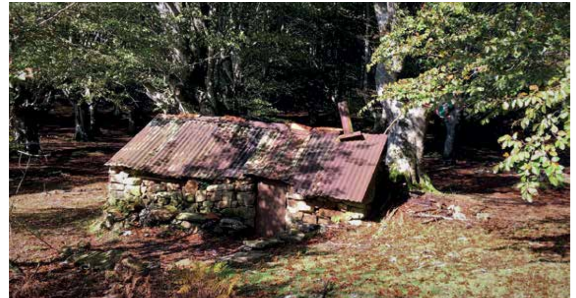
Zizkiño txabola zaharberri aurretik.